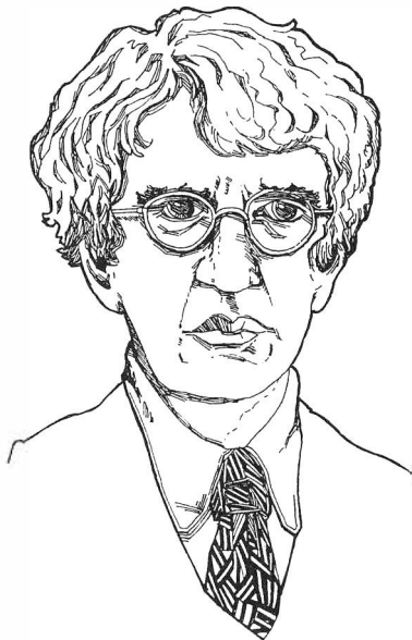
John Commons – de gradvisa reformernas man.

Commons bedrev forskarstudier under Ely på Johns Hopkins ett