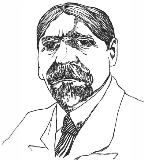
Thorstein Veblen – besökare från en annan värld.