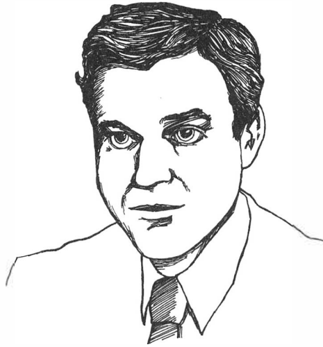
Gunnar Myrdal – institutionalist med fördröjning.