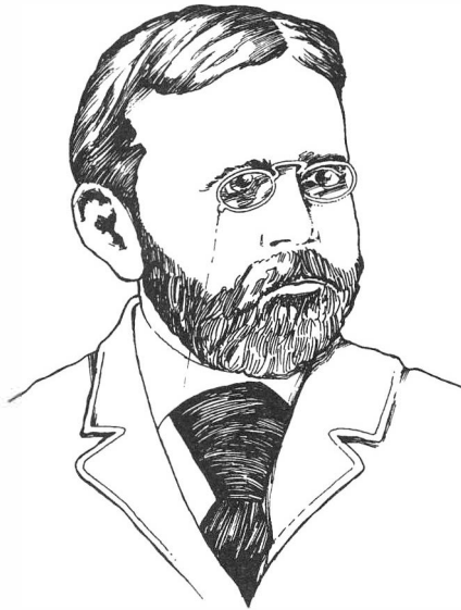
Richard Ely – en mänsklig dynamo.

Ely växte upp i en strängt religiös miljö i delstaten New York. Under sina studier vid Columbia fick han ett stipendium för tre års utlandsstudier. Han for till Tyskland 1877 och träffade en annan amerikansk student, Simon Patten, som introducerade honom för Johannes Conrad i Halle. Ely bestämde sig för att studera ekonomi för att kunna ”stå med fötterna på jorden”. 40 1879 flyttade han till Heidelberg och studerade för Karl Knies – som han betecknade som sin Meister – och Johann Bluntschli och tog sin doktorsgrad i ekonomi. Han for därefter till Berlin och arbetade för Ernst Engel och Adolph Wagner. 41