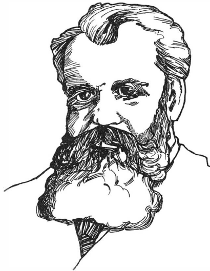
Gustav von Schmoller – förankrad i tid och rum.

gebung, Verwaltung und Volkswirtschaft im Deutschen Reich eller – kort och gott – Schmollers Jahrbuch . I en lång rad monografier gav han detaljerade historiker över skråväsende, industrier, finanspolitik, städer, klasskamp och merkantilism.