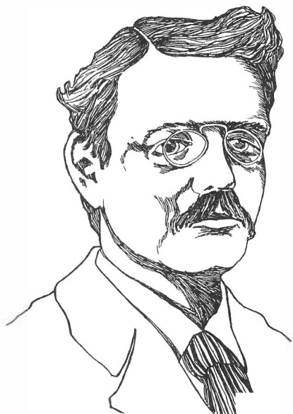
Knut Wicksell – teoretiker och ingen tyskvän.

I augusti inledde Wicksell sin stora studieresa med att åka till London. Det var ingen duvunge som gav sig ut i vida världen. Wicksell var 35 år och hade tidigare tillbringat en sejour i London. Hösten