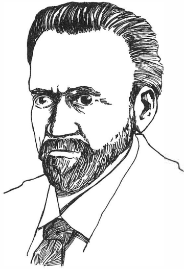
Gustav Cassel – imponerad av Wagner.

mera av teoretiker men ”en temligen ytlig sådan, som endast sysslar med halflärda definitioner”. 4 Schönbergs föreläsningar motsvarade följaktligen inte Cassels föreställning om vad som var vetenskap och Neumann ”föreläste värdelära med ett oändligt uppradande av skilda värdebegrepp”. Men Cassel blev inte avskräckt utan tvärtom sporrad. ”Under dessa veckor mognade mitt beslut att avskaffa hela värdeläran och bygga upp en ekonomisk teori direkt på ett studium av prisbildningen”, förklarar han i sina memoarer. 5 Giöbel-Lilja kan med citat ur ett brev från Cassel till hustrun Johanna bestyrka hans minnesbild: ”Jag har kommit till en ganska fulländad värde-teori, som jag utarbetar hvarje dag – dvs jag har inget skrivit ännu, men jag går igenom litteratur och gör mina anteckningar [. . .].” 6 Cassel förberedde sin första ekonomiskteoretiska uppsats – som blev ”Grundriss einer elementaren Preislehre” – i avsikt att (genom att uttrycka alla värden i en gemensam enhet, penningen) ersätta värdeläran med en prislära och konstruera ”skelettet till en fullständigare prisbildningslära”. 7