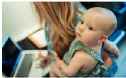
Forskarens utvärdering av barns inverkan på hennes karriär.

Uppdaterat 2018-09-18. Publicerat 2018-09-18