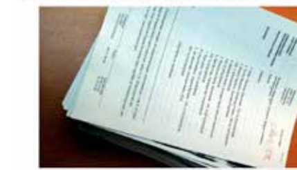
Myndigheterna hjälper kriminella.