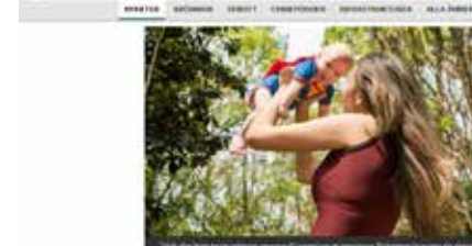
En kvinna som håller sitt barn.

Ledare i Sverige står i spaget mellan offentlighetsprincipen och starka säkerhets. Så kan det inte fortsätta om vi ska stå på mot brottsligheten.