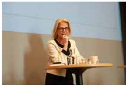
Konferensprogram 8 oktober 2018 i Stockholm.